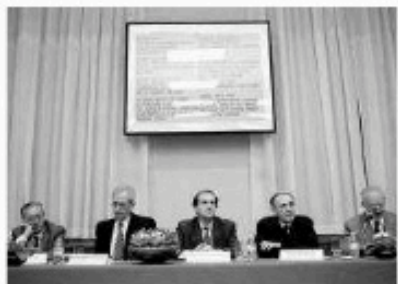
Acto de celebración del 2º aniversario de la entidad en Navarra.