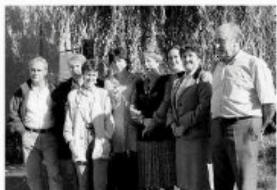
Grupo de voluntarios de la fundación navarra en el año 1996.

El 19 de mayo la entidad celebrará unas Jornadas Técnicas dirigidas por profesionales sobre la drogadicción, en colaboración con la UPNA y por último, el 30 de junio se llevará a cabo un acto social con personas, entidades e instituciones que les han acompañado durante los 25 años. ■