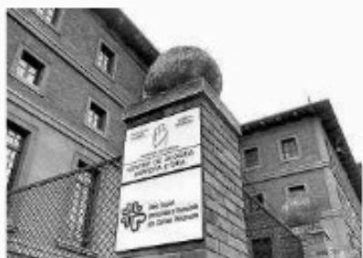
Contacto de las Unidades, primera sede de la fundación en Pamplona.